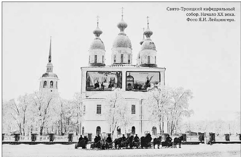
Свято-Троицкий кафедральный собор. Начало XX века.

газета «Архангельск – Город воинской славы»